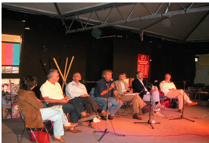
Foto: Settembre 03 Festa Nazionale dell'Unità a Bologna - dibattito sul Riconoscimento dello Shiatsu

G ia da qualche mese è stata presentata alla XII Commissione Affari Sociali della Camera dei Deputati la proposta di legge dell'On. Lucchese (UDC) che può essere considerato un vero e proprio testo unico per quanto riguarda le norme per le Medicine non convenzionali. Esse sono state divise in discipline che possono essere esercitate solo da medici, come l'omeopatia, l'Agopuntura ect, altre che possono essere praticate da Medici e non come la Chiropratica e l'Osteopatia e infine le tecniche praticabili da non medici fra le quali c'è lo Shiatsu. Per queste ultime si prevede il Diploma Universitario che si può conseguire dopo tre anni e 180 crediti formativi, pari a 4500 ore di formazione. Sono previste norme transitorie che consentono a chi abbia conseguito un diploma precedentemente all'entrata in vigore della nuova normativa di ottenere l'equipollenza e ove i suoi titoli non siano ritenuti sufficienti una apposita Commissione stabilirà quale percorso integrativo sia necessario. Noi ci battiamo perché il mondo dello